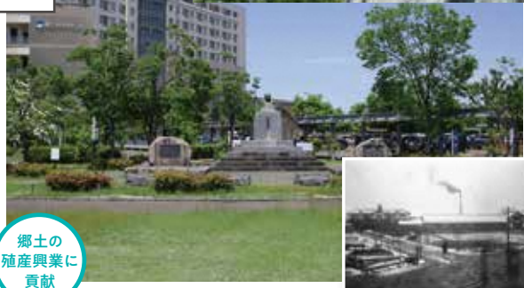
大倉製糸新発田工場